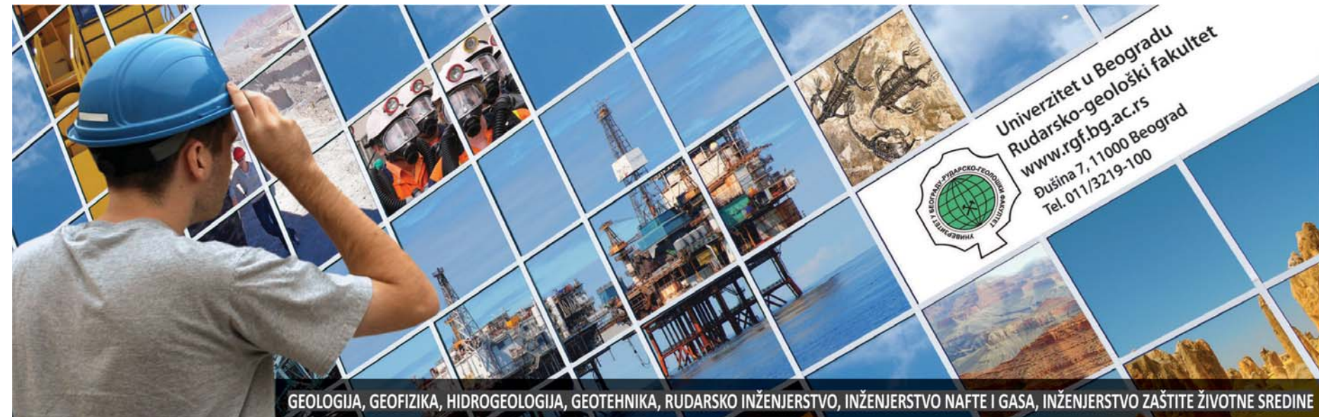
GEOLOGIJA, GEOFIZIKA, HIDROGEOLOGIJA, GEOTEHNIKA, RUDARSKO INŽENJERSTVO, INŽENJERSTVO NAFTI I GASA, INŽENJERSTVO ZAŠTITE ŽIVOTNE SREDINE

Уџбенички комплет „Истражујемо свет око нас 1“ издавачке куће БИГЗ школство ушао је у најужи избор за награду Најбољи европски уџбеник која се сваке године традиционално додељује на Међународном сајму књига у Франкфурту.